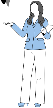
Okul Psikolojik Danışmanı

Devamsızlık, öğrencinin velisinin bilgisi dışında veya izinsiz, sevksiz, raporsuz okula gelmemesi durumudur.